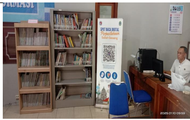
Gambar 2 : Ruang pelayan baca dan layanan informasi Perpustakaan Suluh Gesang Wareng Kapanewon.