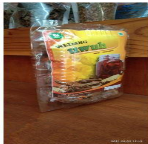
Gambar 9: Kemasan produk Wedang Uwuh salah satu UMKM Kalurahan Wareng.