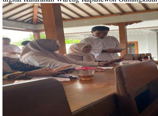
Gambar 7: Pendampingan literasi digital spot baca digital