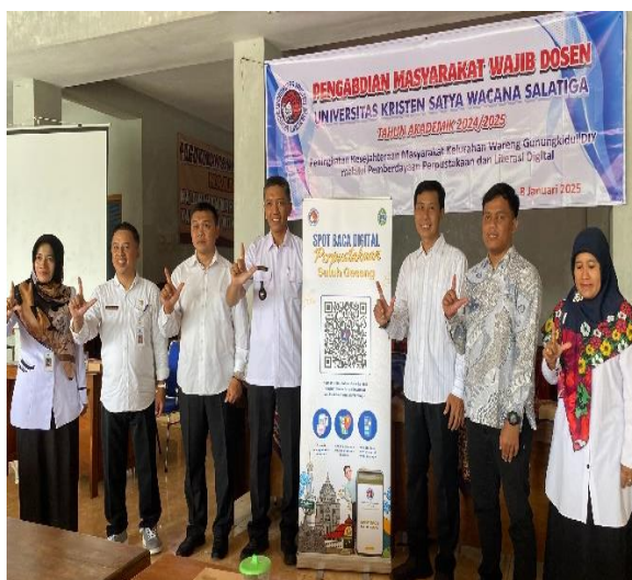
Gambar 4: Peresmian spot baca digital di Kalurahan Wareng Kapanewon Gunungkidul DIY

Penyediaan spot baca digital di perpustakaan Suluh Gesang Kalurahan Wareng Kapanewon Gunungkidul DIY merupakan salah satu upaya agar masyarakat memiliki alternatif pilihan dalam pengalaman menelusuri informasi. Penyediaan spot baca digital bukan berarti mengesampingkan koleksi buku tercetak, namun lebih dari itu sebagai salah bentuk perluasan pelayanan informasi bagi masyarakat agar semakin bertambah pengetahuan, keterampilan dan pengalaman dalam mengikuti perkembangan teknologi informasi khususnya dalam pemanfaatan koleksi perpustakaan bagi peningkatan pengetahuan dan kesejahteraan.