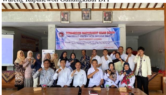
Gambar 6: Peserta dan stakeholder kegiatan Pengabdian Masyarakat