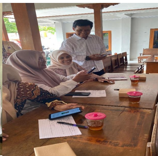
Gambar 5: Pendampingan literasi digital spot baca digital Kalurahan Wareng Kapanewon Gunungkidul