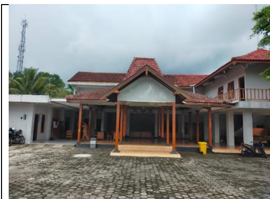
Gambar 1: Kalurahan dan Balai Kalurahan Wareng Kapanewon Gunungkidul tempat pelaksanaan kegiatan pengabdian masyarakat.

Berdasarkan dari keadaan tersebut maka kegiatan pengabdian masyarakat diarahkan dalam rangka berupaya dalam peningkatan kesejahteraan masyarakat melalui pengembangan perpustakaan dan literasi digital dalam meningkatkan pengetahuan dan wawasan masyarakat Kalurahan Wareng Kapanewon Gunungkidul.