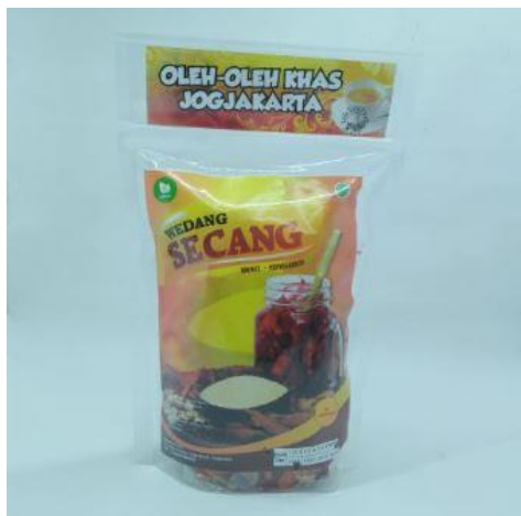
Gambar 8 Kemasan produk Wedang Secang Yuniari salah satu hasil UMKM Kalurahan Wareng.