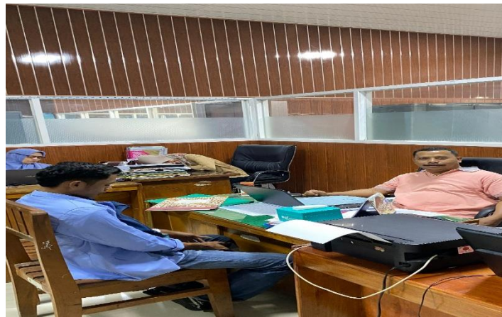
Foto 1. Wawancara