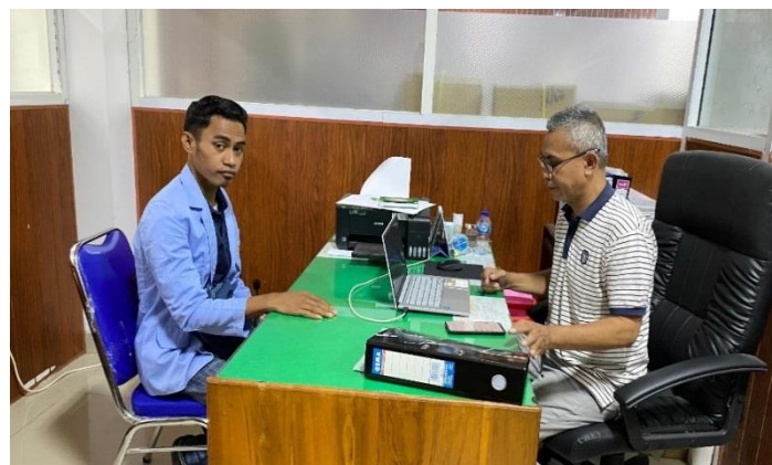
Foto 2. Wawancara